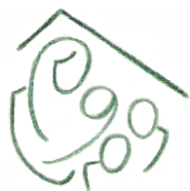
Azylový dom Tamara